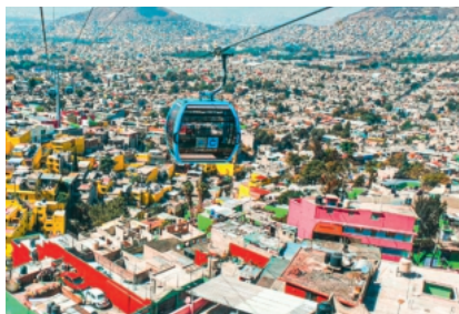
Fatzer stellt Seile für Seilbauwerke, spezialisierte Bereiche des Bergbaus und Transportseilbahnen – darunter alle Weltrekordseilbahnen – her.