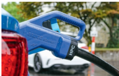
Brugg eConnect entwickelt Lösungen für E-Mobilität (DC-Schnellladesysteme), Windenergie (Torsions- und Turmkabel) und Industrie (Standard- und Spezialkabel).