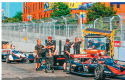
Geobrugg stellt hochfeste Schutznetze für Natur, Minen und Bergbau sowie den Motorsport, den Verkehr und den Einschlagschutz her.