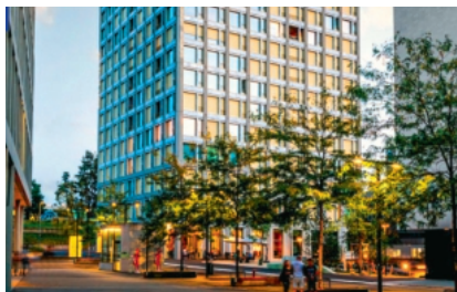
Brugg Real Estate betreibt die Immobilien und Landreserven der Gruppe. Nach dem Bau des Centurion Towers entstehen weitere Gebäude in Brugg und Birm.

BRUGG: Präsentation der Jahresbilanz 2022 in den Räumlichkeiten von Brugg Pipes in Böttstein