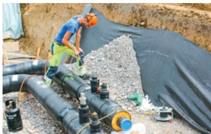
Brugg Pipes stellt Rohrsysteme in den Bereichen Nah- und Fernwärme, Tankstellen und Tankanlagen, Kühlung, Kaltwasser und für die Industrie her.