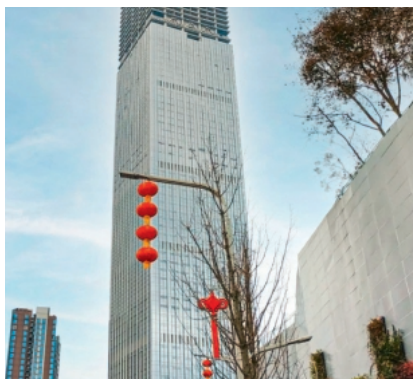
Brugg Lifting ist Herstellerin von Aufzugs-, Architektur- und Drahtseilen sowie von Zurr- und Hebemitteln im Bereich des Gebäudebaus und der Sicherung.