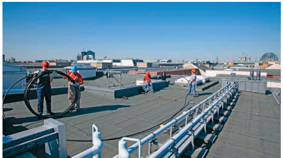
Verlegung des FLEXWELL-Sicherheitsrohres® auf dem Dach

Der „Notstromfall“ ist das Aufrechterhalten der elektrischen Energieversorgung bei einem Ausfall des Stromnetzes durch ein Notstromaggregat. Notstromaggregate können überall dort Anwendung finden, wo der Ausfall des Stromnetzes gravierende Folgen nach sich ziehen würde – wie z. B. in Krankenhäusern, chemischen Anlagen, Serverräumen und nicht zuletzt in Ämtern und Bundesbehörden, um auch im Falle