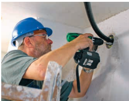
Abschottung des FLEXWELL-Sicherheitsrohres® mit bauartzugelassener Brandschutzdurchführung

wird aus dem Vorratstank (Standort Keller oder Erdreich) gespeist. Die Verbindung von Vorratstank und Tagestank wird gerne mittels des flexiblen FLEXWELL-Sicherheitsrohres® hergestellt, welches sich seit Jahrzehnten für diese Anwendung bewährt hat. Durch die Doppelwandigkeit des Sicherheitsrohres