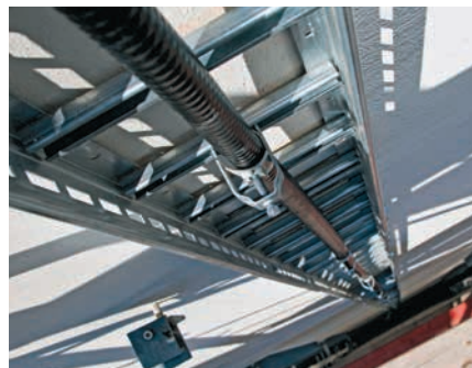
Einfache Fixierung des FLEXWELL-Sicherheitsrohres® mit Systemtechnik (Montageschiene und Kabelsattelschellen)