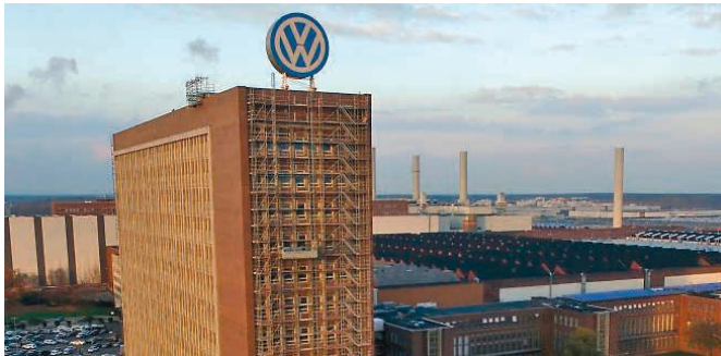
Das VW-Verwaltungshochhaus in Wolfsburg