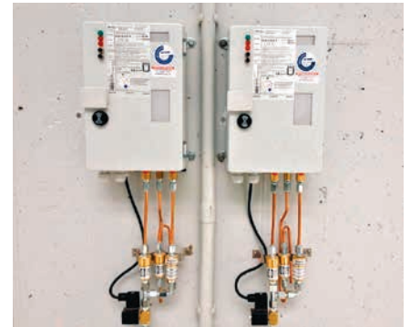
Leckanzeiger VLR 410 EP für die Montage im Freien

Für Kontaktaufnahme und weitere Informationen bitte ausfüllen und absenden an Fax +49 (0)5031 170-170 oder per E-Mail an info.brg@brugg.com