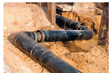
BRUGG-STAMANT®-Sicherheitsrohr mit Montage-Dehnungselement