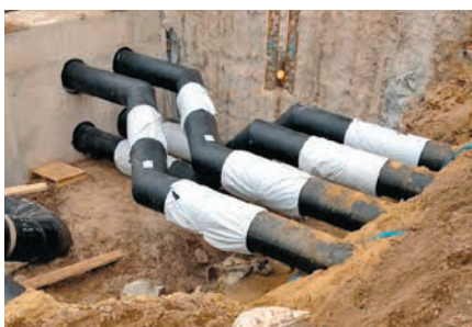
Anschluss der Technikzentrale an die Kaltwasserversorgung mit PREMANT®

Die unterirdische Verlegung erfolgte innerhalb von vier Bauabschnitten zwischen Mai und Juli 2015. Der Zeitplan war fixiert und der Montageablauf ließ daher keinerlei Verspätungen zu. Das Projekt mit Vorlage des