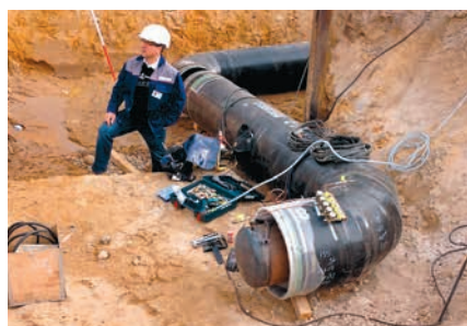
Zerstörungsfreie Druckprüfung vor Ort